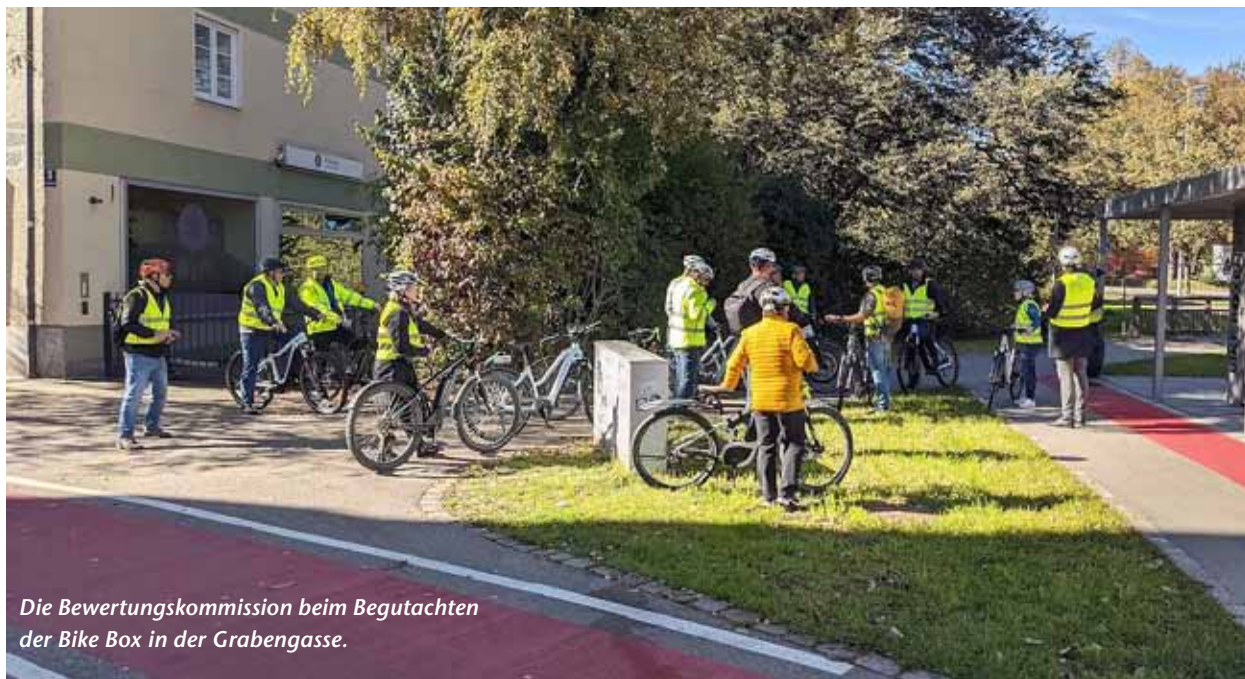
Die Bewertungskommission beim Begutachten der Bike Box in der Grabengasse.