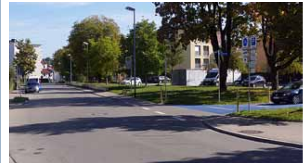
Die Madlenerstraße wird zur zweiten Fahrradstraße in Kempten. Text: Tobias Heilig

Der ADFC begrüßt auch den Einbau der elektrisch versenkbaren Poller. Außer der Durchsetzung des bereits bestehenden nächtlichen Durchfahrtsverbots ändert sich zwar durch die elektrisch versenkbaren Poller vorerst nichts, aber es wird somit auch eine Option für zukünftige weitere Sperrungen geschaffen. Diese könnten dann, wenn die Poller erst einmal installiert sind, sehr einfach beschlossen und realisiert werden.