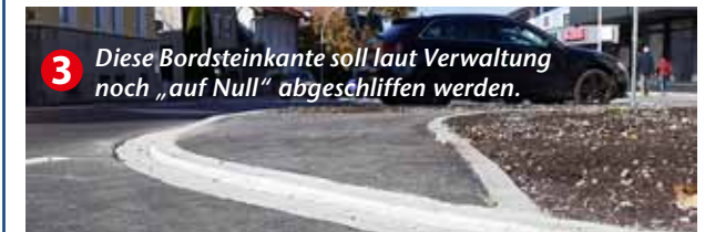
3 Diese Bordsteinkante soll laut Verwaltung noch „auf Null“ abgeschliffen werden.