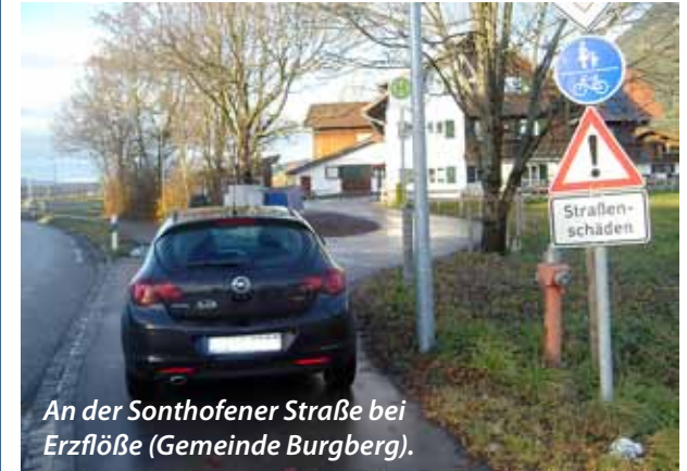
An der Sonthofener Straße bei Erzflöbe (Gemeinde Burgberg).