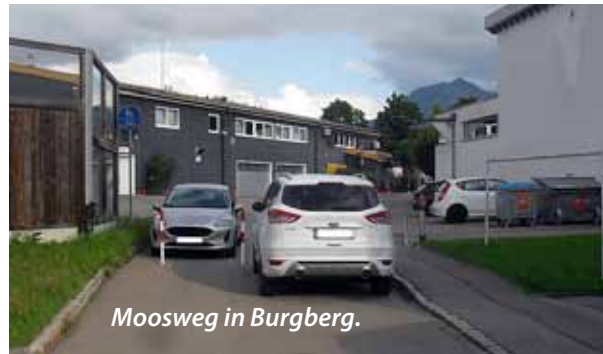
Moosweg in Burgberg.