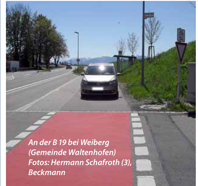
An der B 19 bei Weiberg (Gemeinde Waltenhofen)